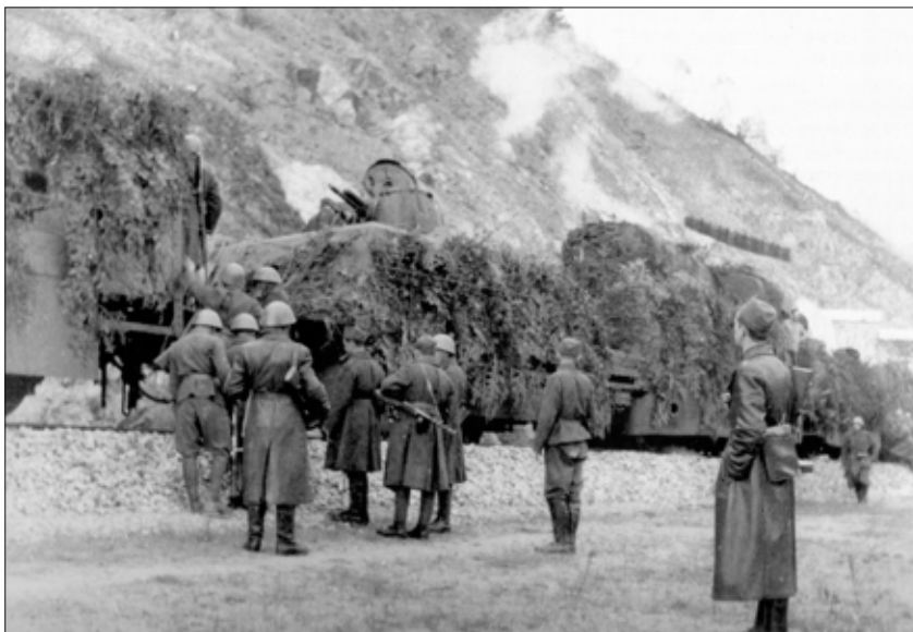
Obrázok 8: Zamaskovaný pancierový vlak Hurban v Hornom Harmanci