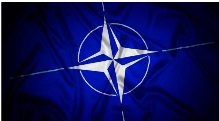
Obrázok 1: NATO

Prvá kapitola je venovaná základným informáciám o Aliancii a je koncipovaná ako úvodné pozvanie do problematiky. Bez základných znalostí historických súvislostí a organizačnej štruktúry by bolo náročné zasadiť príbeh Slovenskej republiky do kontextu.