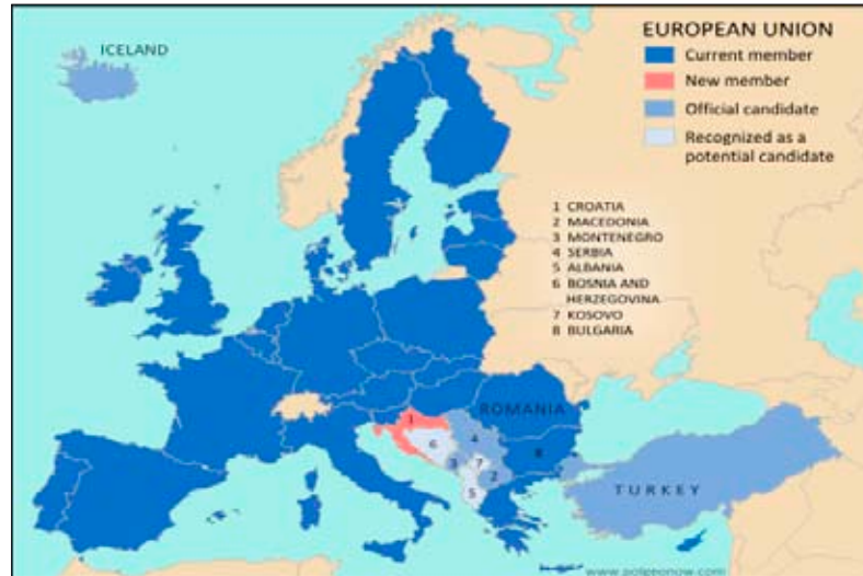
Obrázok 1: Členské a kandidátske krajiny EÚ

sabonská zmluva priniesla niekoľko dôležitých prvkov pre fungovanie EÚ. EÚ získala právnu subjektivitu, čo znamená, že je spôsobilá byť nositeľom práv a povinností, spôsobilá na právne úkony a spôsobilá niesť právnu zodpovednosť za porušenie svojich medzinárodno-právnych záväzkov.