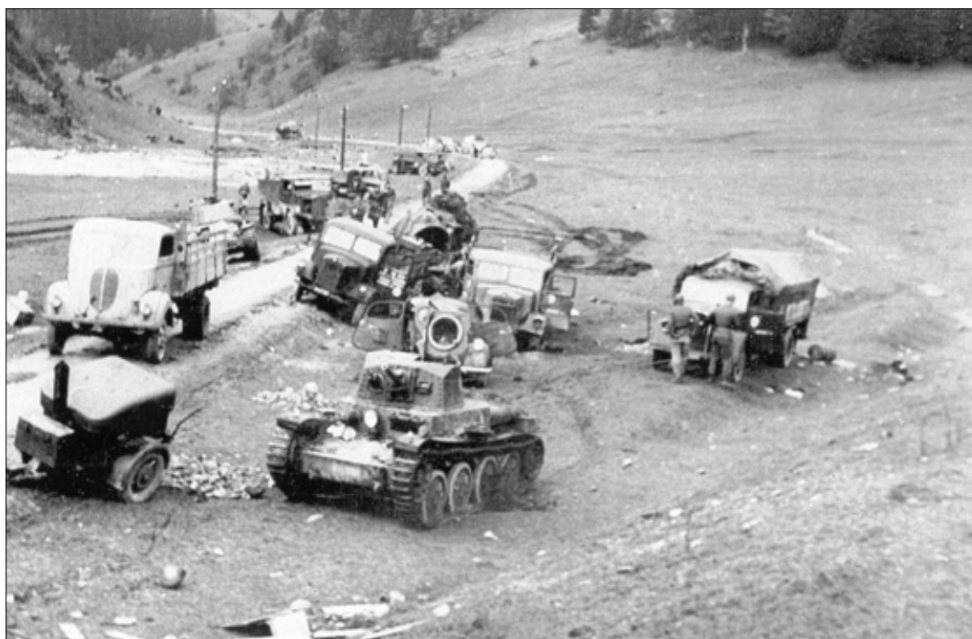
Obrázok 14: Ústup povstalcov Starohorskou dolinou

Dňa 26. októbra 1944 sa Veliteľstvo 1. čs. armády na Slovensku presunulo na Donovaly, kam už predtým prišli aj politické orgány povstania. Odtiaľ nariadil gen. Viest do rána 27. októbra opustiť Banskú Bystricu. Ústup statočne kryli jednotky 2. čs. samostatnej paradesantnej brigády.