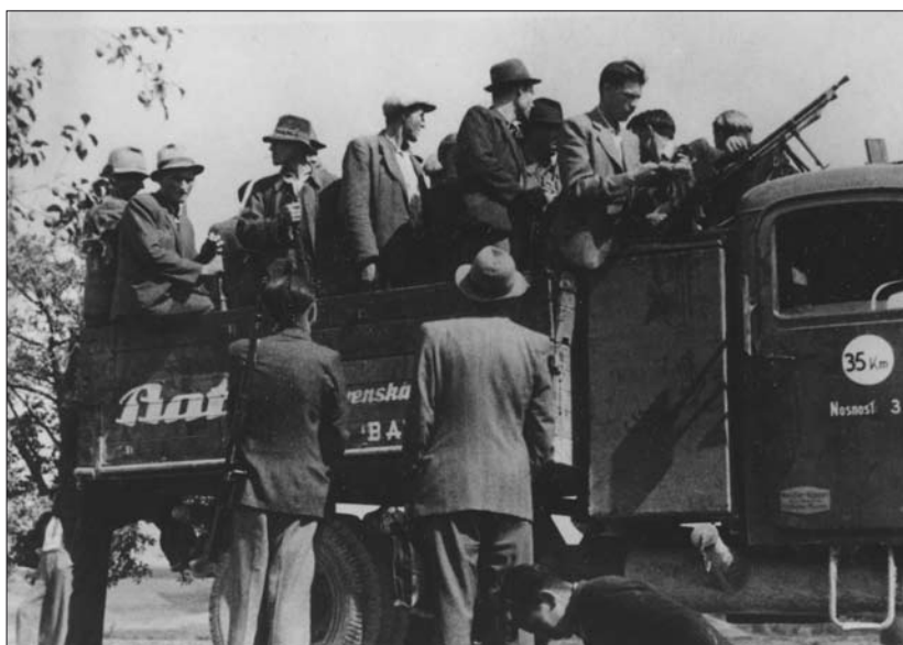
Obrázok 2: Dobrovoľníci odchádzajú do SNP v Baťovanoch (dnes Partizánske)

Slovenské národné povstanie sa začalo ako odpoveď na vstup nemeckých okupačných jednotiek na územie Slovenska za podmienok, keď nebola zabezpečená koordinácia so sovietskou Červenou armádou, tzn. podľa nevýhodného variantu začiatku. Práve vzhľadom na tento spôsob začiatku povstania, nebol stav pripravenosti vojenských posádok na ozbrojené vystúpenie všade na požadovanej úrovni. Predpoludním 29. augusta 1944 vydalo Vojenské ústredie rozkaz k najprísnejšej bojovej pohotovosti vojenských posádok a večer, po známom rozhlasovom prejave gen. I. tr. Ferdinanda Čatloša oznamujúcom príchod nemeckých vojsk, vydalo rozkaz k ozbrojenému odporu proti nastupujúcim nemeckým okupačným jednotkám. Povstanie sa veľmi rýchlo rozšírilo na vyše tridsať vtedajších okresov s rozlohou asi 20 000 km 2 s približne 1,7 mil. obyvateľmi a siahalo na východe po Levoču, Spišskú Novú Ves a Dobšínú a na západe až po Žilinu, Bánovce nad Bebravou a Topoľčany. Na severe a na juhu sa povstalecké územie dotýkalo až štátnych hraníc. Politickú moc na tomto území prevzali za pomoci povstaleckých jednotiek revolučné národné výbory.