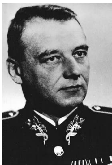
Obrázok 9: div. gen. Rudolf Viest, po 7. 10. 1944 veliteľ povstaleckej 1. čs. armády na Slovensku