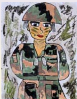
2. miesto: Lukáš VOJTEK Kategória: Detská tvorba Moja mama rodinný príslušník