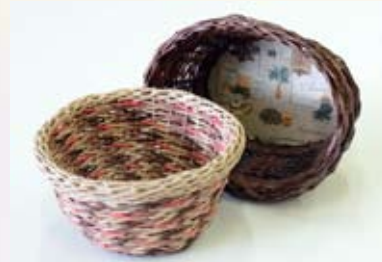
3. miesto: Zdenka NAVRÁTILOVÁ Kategória: Úžitkové umenie košík upletený z papiera AOS Liptovský Mikuláš