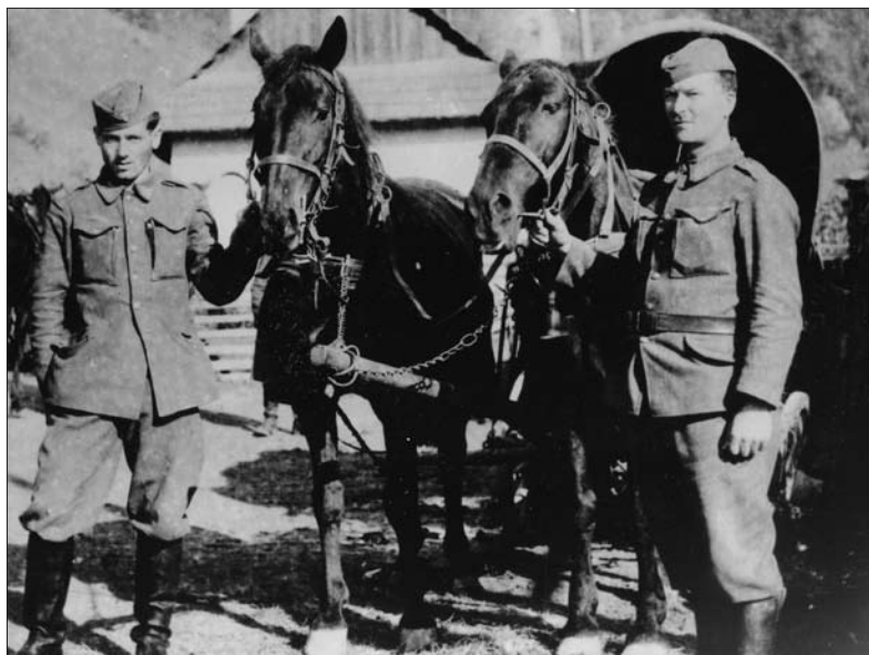
Obrázok 11: Povstaleckí vojaci v Harmanci