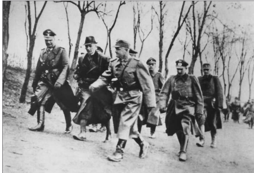
Obrázok 7: Gen. H. Höfle (vľavo) a predseda slovenskej vlády Štefan Tiso (v strede) navštívili bojisko

novu Lehotu a utrpení ťažkých strát (dva prápory boli vyradené z boja) povstalci ustúpili a stratili Janovu Lehotu a 27. septembra aj Žarnovicu. III. taktická skupina musela vyprázdniť celý priestor medzi Žarnovicu a Hronským Beňadikom. 3. októbra sa nepriateľ zmocnil aj Svätého Kríža nad Hronom a povstaleckým jednotkám medzi Žarnovicu a Svätým Krížom odrezal ústupovú cestu cez Svätý Kríž, preto sa povstalci presunuli cez Vyhne do Banskej Štiavnice.