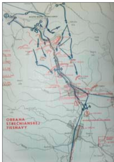
Obrázok 3: Mapa bojov o Strečniansku tiesňavu