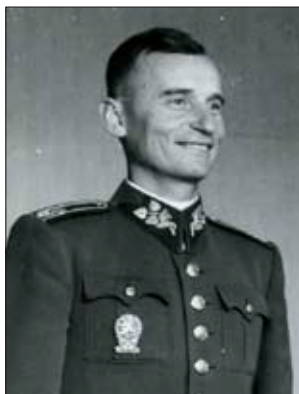
Obrázok 5: brig. gen. J. Golian, do 7. 10. 1944 veliteľ povstaleckej 1. čs armády

ska. Jej predsedom sa stal veliteľ povstaleckej armády brig. gen. J. Golian (neskôr div. gen. R. Viest) a členmi traja ním menovaní zástupcovia armády, dvaja zástupcovia Slovenskej národnej rady a dvaja zástupcovia Hlavného štábu partizánskych oddielov. Od činnosti tohto orgánu sa predovšetkým očakávalo, že sa dosiahne potrebná súhra medzi velením armády a partizánov. Rozhodnutia rady mali byť záväzné pre všetky vojenské a partizánske veliteľstvá.